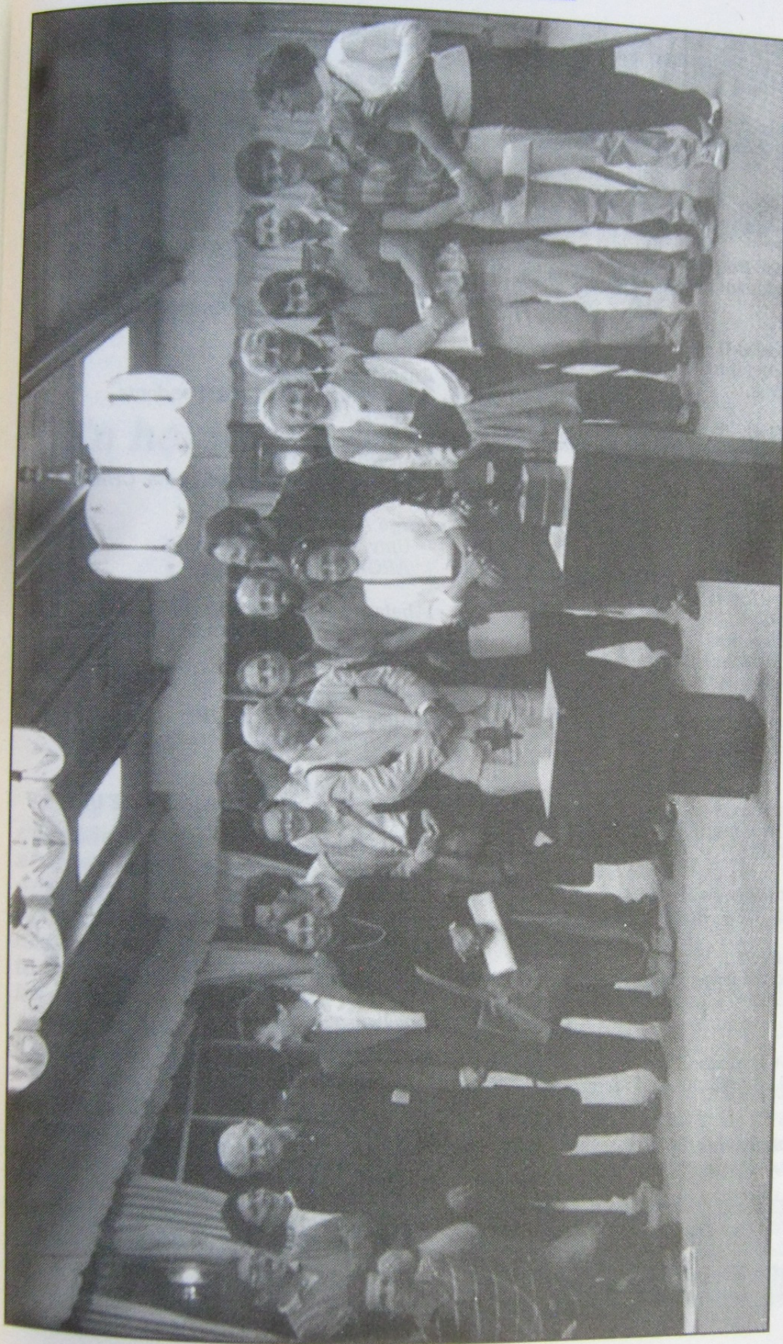
Participantes en el Segundo Simposio sobre Arqueología Sudamericana. Cuenca Ecuador, del 13 al 17 de enero de 1992.